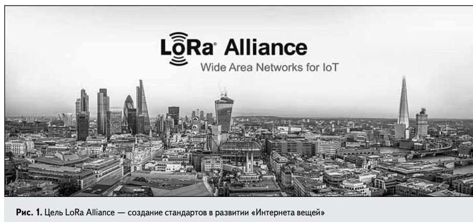
Рис. 1. Цель LoRa Alliance — создание стандартов в развитии «Интернета вещей»

Шлюзы подключаются к сетевому серверу через стандартные IP-соединения, а конечные устройства используют односкачковую беспроводную связь к одному или нескольким шлюзам. Все конечные точки связи, как правило, являются двунаправленными, но они