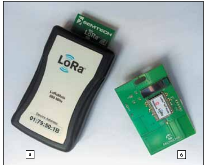
Рис. 2. Оконечные устройства для демонстрационных целей: а) LoRaMote производства Semtech; б) LoRa IoT Node производства Microchip

Оконечные устройства (End Points) являются элементами сети системы LoRa, где они выполняют такие функции, как измерение или управление и контроль. Они располагаются удаленно и имеют батарейное питание. Используя сетевой протокол LoRaWAN, эти конечные точки могут быть настроены для связи с шлюзом LoRa (концентратором или базовой станцией) — рис. 3.